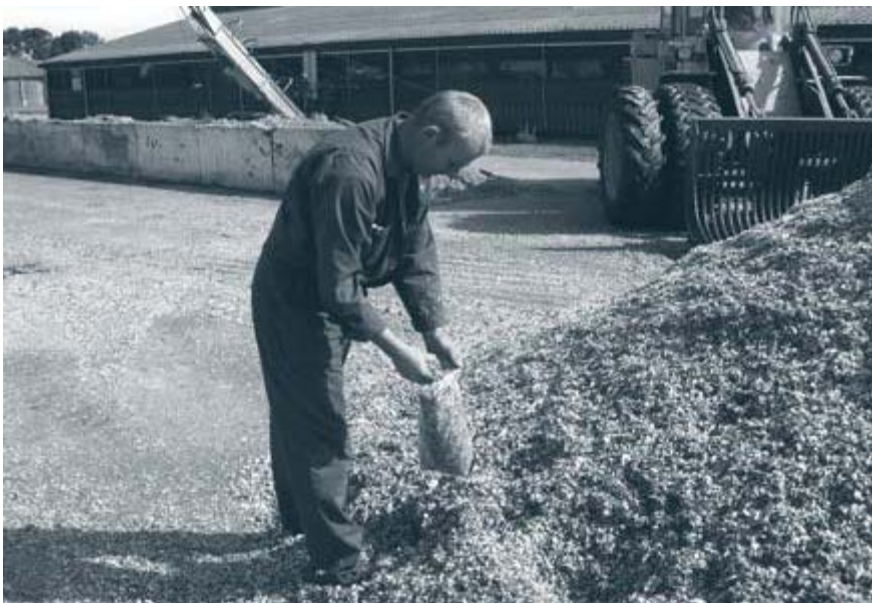
Bemonstering van verse snijmaïs voor bepaling van de voederwaarde.